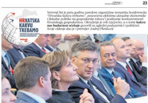
ŽELIM HRVATSKO koja ima sve moguće certifikate na svom reверu. Ciljevi Vlade su kakva je tekao premijer, politička stabilnost, socijalna kohezija unatoč krizama te izbjeci situaciju da se dio građana osjeća bespomoćno, da se više perspektivi