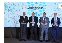
IZBOR VEČERNJEG LISTA I POSLOVNOG DNEVNIKA

Ljudima je potrebna motivacija da teže izvrsnosti