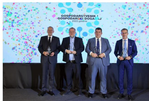
DOGAĐAJI I LJUDI KOJI MIJENJAJU GOSPODARSKU I DRUŠTVENU KLIMU